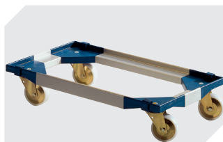
Plateaux roulants pour bacs de distribution MB 800 x 400 mm et 800 x 600 mm l 720 x l 540 mm 6-19439