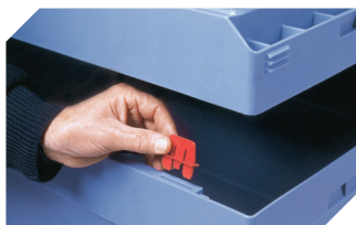
Clips de fermeture 6-15625