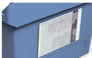
Pochettes porte-documents fixation auto-adhésive 3 côtés ouverts l 175 x l 105 mm 6-5031