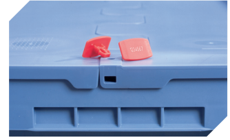
Plomben MBP2-L - für BITOBOX MB, XL, SL 6-19162