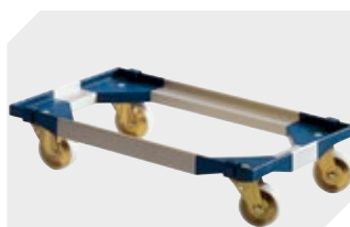
Transportroller für Mehrwegbehälter 800 x 400 mm und 800 x 600 mm L 720 x B 540 mm 6-19439