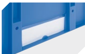
Etikettenabdeckungen für Mehrwegbehälter MB B 60 x H 80.4 mm 6-15244