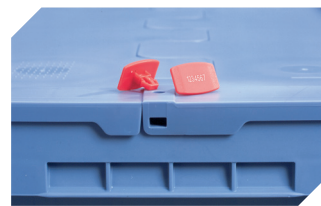
Plomben MBP2-L - für BITOBOX MB, XL, SL 6-19162