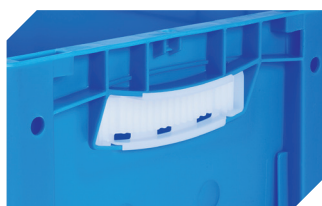
Obturateurs pour poignées ouvertes pour bacs gerbables norme Europe, série XL d'une hauteur de 170, 220 et 270 mm 43-31450