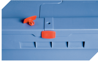
Plomben MBP2 - für BITOBOX MB 6-15705