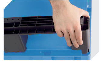
Kufensets für Eurostapelbehälter XL 43-20273