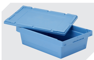
Couvercle coiffant pour bacs de distribution, série MB l 400 x l 300 mm 6-30277