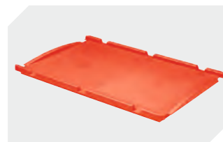
Auflagedeckel für Eurostapelbehälter XL L 600 x B 400 mm 43-20494