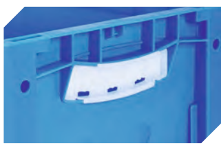
Griffverschlüsse für Eurostapelbehälter XL Höhen 320 und 420 mm 43-31448