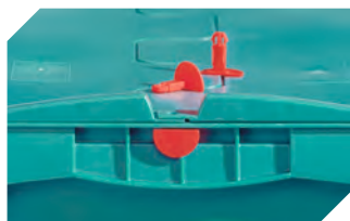
Plomben für Eurostapelbehälter XL und Kleinladungsträger KLT 9-16271