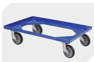
Transportroller Material Rad: Gummi L 620 x B 420 mm 43-21883