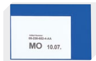
Etikettentaschen selbstklebend 2 Seiten offen L 145 x B 100 mm 46-21108