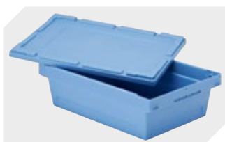
Stülpedeckel für Mehrwegbehälter MB L 400 x B 300 mm 6-30277