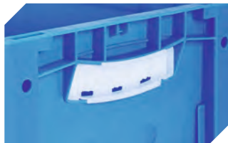
Griffverschlüsse für Eurostapelbehälter XL Höhen 170, 220 und 270 mm 43-31450