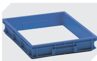
Rehausse l 600 x l 400 x H 78 mm 4-1568