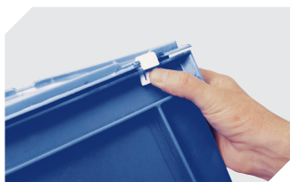
Charnières fermeture couvercle pour bacs gerb. norme Europe, série BN 4-1144