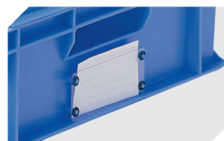
Protège-étiquettes pour bacs gerb. norme Europe, série BN système évolutif l 110 x H 46 mm 4-9454