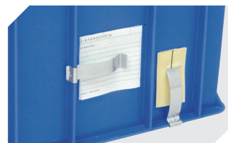
Clips porte-documents pour bacs gerb. norme Europe l 80 x l 18 mm 4-1492