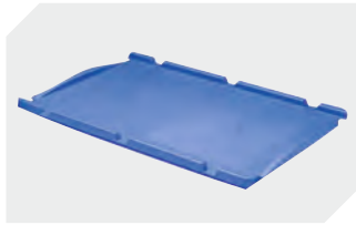
Auflagedeckel für Eurostapelbehälter XL L 200 x B 150 mm 43-30209