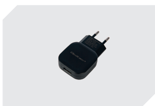
Adaptateur secteur USB 12 W 77-51278