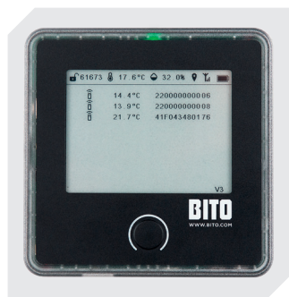
SmartHub système de surveillance Gateway l 129 x l 129 x H 29 mm 77-51269