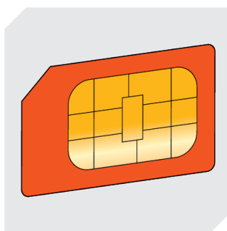
Tarif de données dans le monde entier SmartHub/SmartLock 77-51360