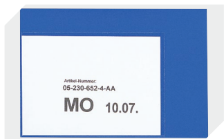
Pochettes porte-documents fixation auto-adhésive 2 côtés ouverts l 145 x l 100 mm 46-21108