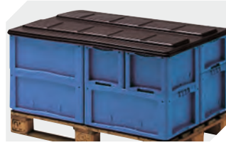
Palettenabdeckhauben L 1220 x B 820 mm 9-18421