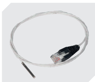
Capteur à glace carbonique Pt100 à 4 fils 77-51272