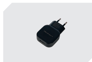
Adaptateur secteur USB 12 W 77-51278