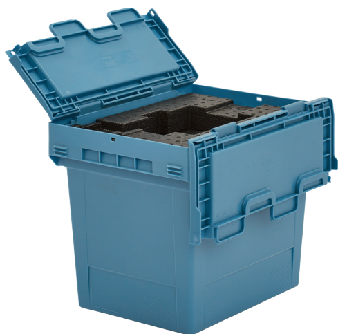
Pos. Dimensions, tolérances conformes à la norme DIN 16901