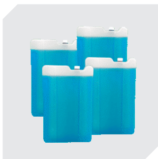
Accumulateur de froid PCM 4°C - 700 ml lot de 4 pièces l 210 x l 135 x H 30 mm 77-51181