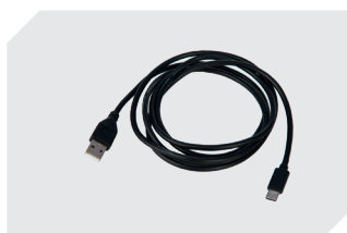
Câble de charge USB Type C version droite l 1800 mm 77-51277