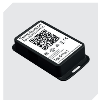
Enregistreur de données Temp-Beacon l 188 x l 45 x H 16 mm 77-51235