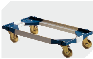
Transportroller für Mehrwegbehälter 800 x 400 mm und 800 x 600 mm L 720 x B 540 mm 6-19439