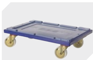
Transportroller für Mehrwegbehälter 600 x 400 mm L 620 x B 420 mm 6-15510