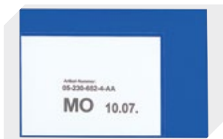
Etikettentaschen selbstklebend 2 Seiten offen L 145 x B 100 mm 46-21108