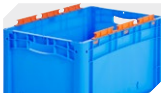
Tütenleisten demontierbar 6-31553