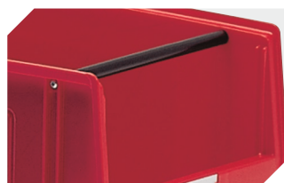
Barres de manutention pour bacs à bec, série PK l 278 mm 2-15849