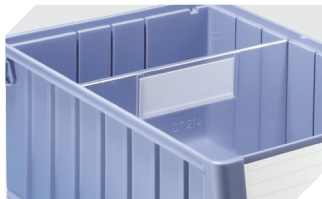
Querteiler für Regalkästen RK 3-1588