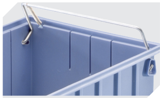
Sicherungs-/Tragebügel für Regalkästen RK 3-1514