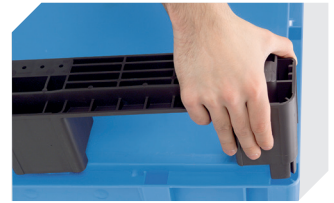
Kufensets für Eurostapelbehälter XL 43-20273