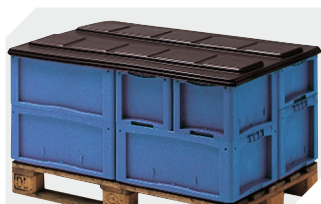
Coiffes pour conteneurs palettisés