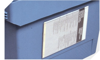
Pochettes porte-documents fixation auto-adhésive 3 côtés ouverts l 175 x l 105 mm 6-5031