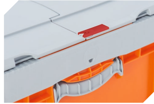
Scellés de sécurité pour bacs pliables BITO EQ 51-31438