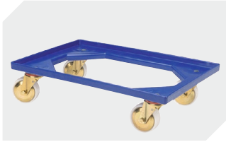
Plateaux roulants matériel des roues : PP l 620 x l 420 mm 43-1491