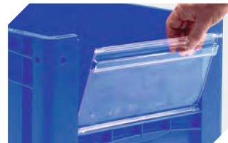
Sichtscheiben für Eurostapelbehälter XL B 460 x H 198 mm 43-22548