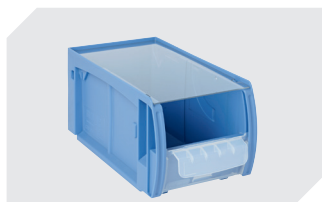
Couvercles anti-poussière CSD pour bacs CTB l 269 x l 148 mm 53-31341