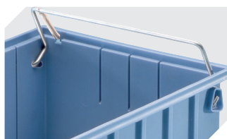
Poignée de sécurité (non compatible avec les couvercles anti-poussière) pour bacs de rangement RK et bacs CTB 3-31314