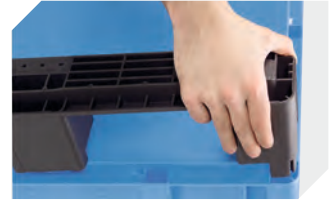
Kufensets für Eurostapelbehälter XL 43-20273