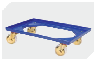
Transportroller Material Rad: PP L 620 x B 420 mm 43-1491