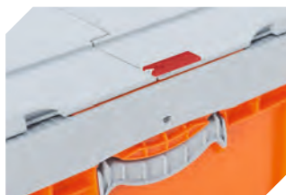
Plomben für BITOKLAPPBOX EQ 51-31438