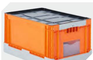
Auflagedeckel für BITOKLAPPBOX EQ L 592 x B 392 mm 51-31437