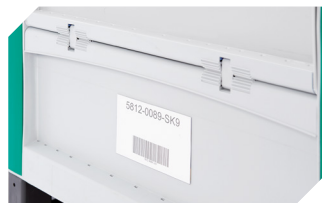
Etikettenhalter B 240 x H 80 mm 52-30386