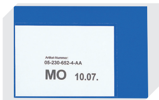
Etikettentaschen selbstklebend 2 Seiten offen L 145 x B 100 mm 46-21108