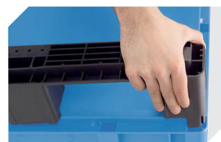
Kit de semelles pour bacs gerbables norme Europe, série XL 43-20273