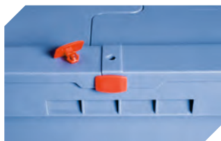
Plomben MBP2 - für BITOBOX MB 6-15705