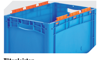
Tütenleisten demontierbar 6-31553