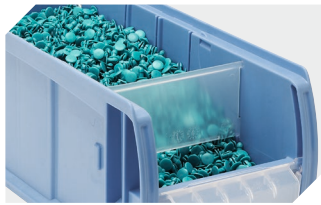
Dosierscheiben CDS für C-Teile-Behälter CTB - mm 53-31304