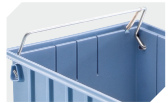
Sicherungs-/Tragebügel für Regalkästen RK und C-Teile-Be- hälter CTB 3-31314