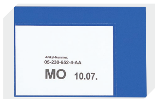
Etikettentaschen selbstklebend 2 Seiten offen L 145 x B 100 mm 46-21108