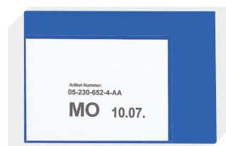
Pochettes porte-documents fixation auto-adhésive 2 côtés ouverts l 145 x l 100 mm 46-21108