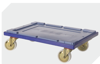
Plateaux roulants pour bacs de distribution MB 600 x 400 mm l 620 x l 420 mm 6-15510