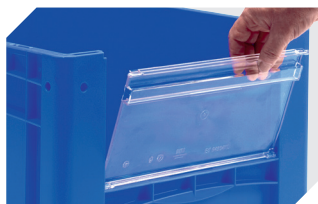
Visière pour bacs gerbables norme Europe, série XL l 460 x H 198 mm 43-22548