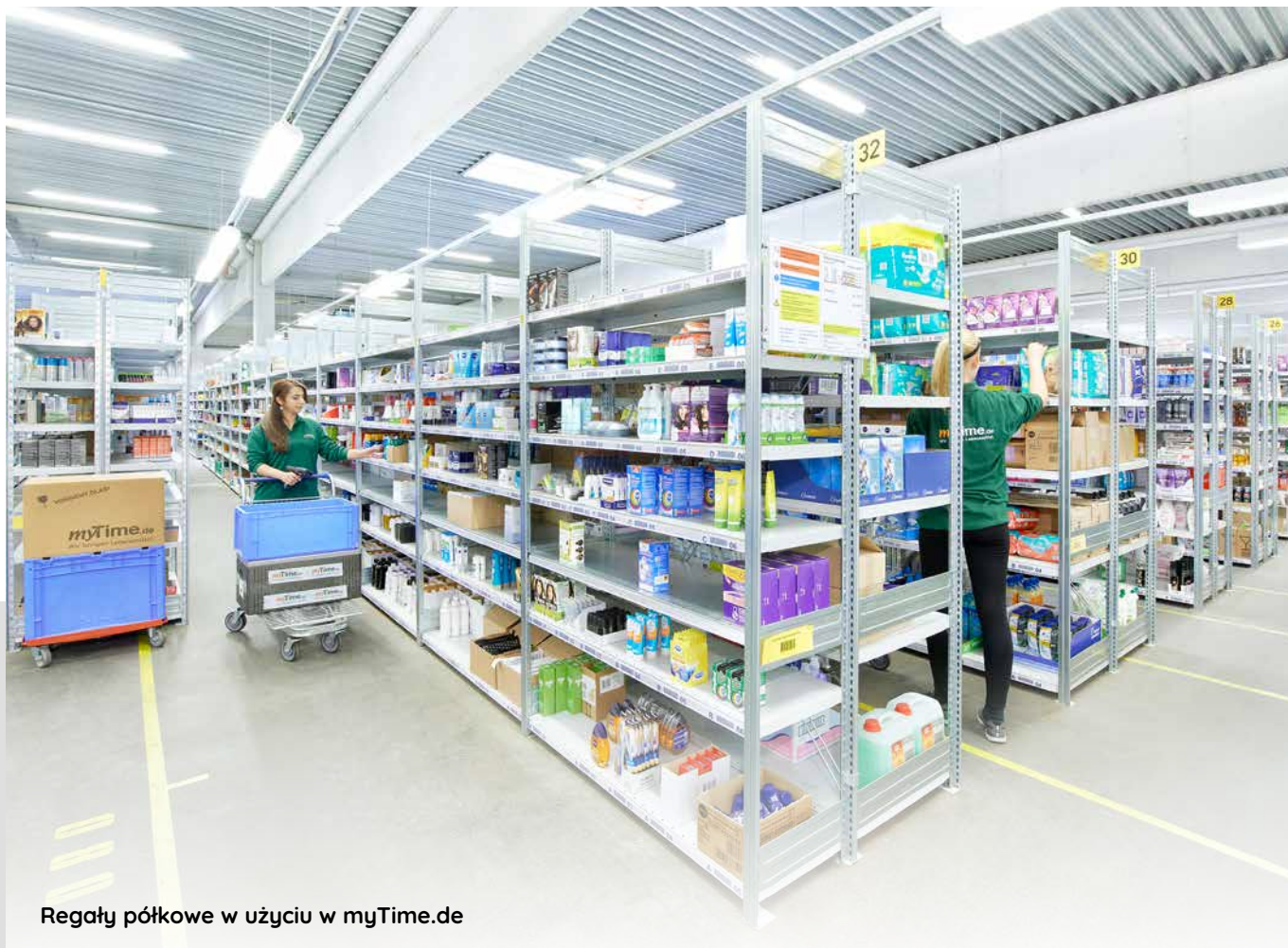
Regały półkowe w użyciu w myTime.de

Systemy regałów półkowych BITO charakteryzują się wysoką jakością wykonania i są odpowiednie do składowania wszystkich możliwych towarów. Dają się optymalnie dopasować do każdej przestrzeni pod względem wysokości i długości, są łatwe w montażu lub przebudowie, i można je bezproblemowo uzupełniać. Są idealne do składowania i komisjonowania jednostek niespaletyzowanych, towarów luzem lub w opakowaniach.