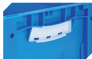
Obturateurs pour poignées ouvertes pour bacs gerbables norme Europe, série XL d'une hauteur de 170, 220 et 270 mm 43-31450