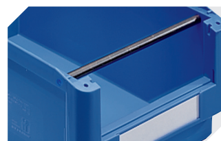
Barres de manutention pour bacs à bec, série SK Ø 15 mm mm 2-19527