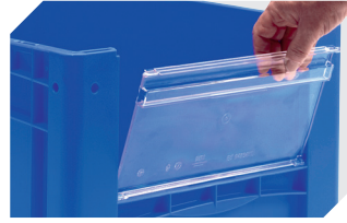
Sichtscheiben für Eurostapelbehälter XL B 460 x H 198 mm 43-22548