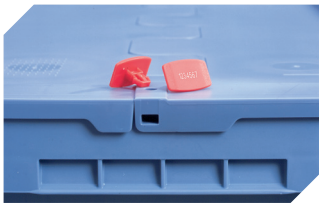
Plomben MBP2-L - für BITOBOX MB, XL, SL 6-19162