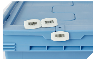
Barcode-Plomben MBP3 - für alle Mehrwegbehälter MB-Größen und XL-Behälter 800 x 600 mm 6-31550