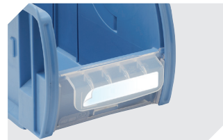
Films protecteurs pour champs d'étiquettes pour bacs CTB 53-31308