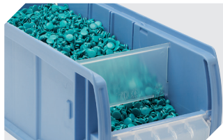
Séparateurs de dosage CDS pour bacs CTB 53-31304