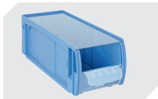
Couvercles anti-poussière CSD pour bacs CTB l 369 x l 148 mm 53-31342