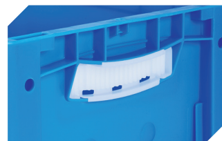
Obturateurs pour poignées ouvertes pour bacs gerbables norme Europe, série XL d'une hauteur de 170, 220 et 270 mm 43-31450