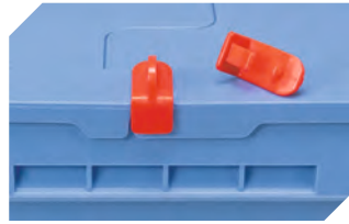
Verschluss-Clips für BITOBOX MB 6-20299