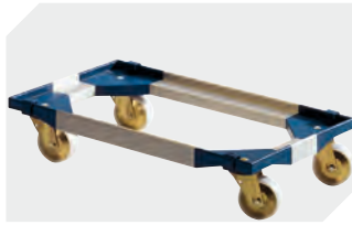
Transportroller für Mehrwegbehälter 800 x 400 mm und 800 x 600 mm L 720 x B 540 mm 6-19439