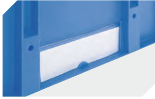
Etikettenabdeckungen für Mehrwegbehälter MB B 60 x H 80.4 mm 6-15244