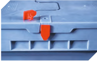
Plomben MBP1 - für BITOBOX MB 6-10810