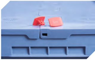
Plomben MBP2-N - für BITOBOX MB, XL, SL 6-19162