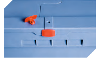
Plomben MBP2 - für BITOBOX MB 6-15705