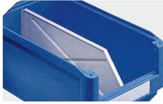
Längsteiler für Sichtlagerkästen SK 2-1075