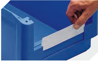
Schutzfolien für Sichtlagerkästen SK L 178 x B 42 mm 2-1066