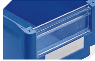
Sichtscheiben für Sichtlagerkästen SK 2-1112