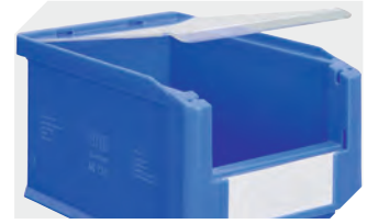
Staubdeckel für Sichtlagerkästen SK L 482 x B 299 x H 2.5 mm 2-1136